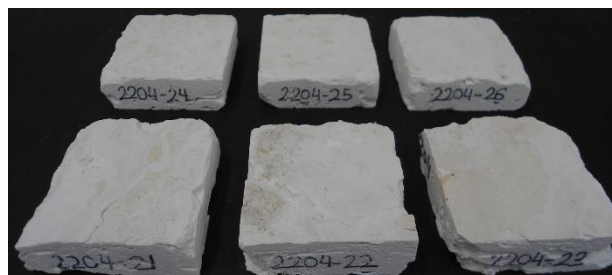
Muestra después de 15 ciclos de cristalización de sales Sample after 15 salt crystallization cycles