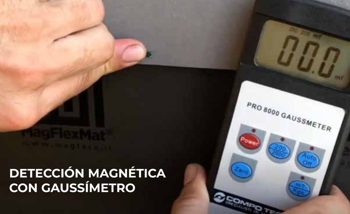
DETECCIÓN MAGNÉTICA CON GAUSSÍMETRO