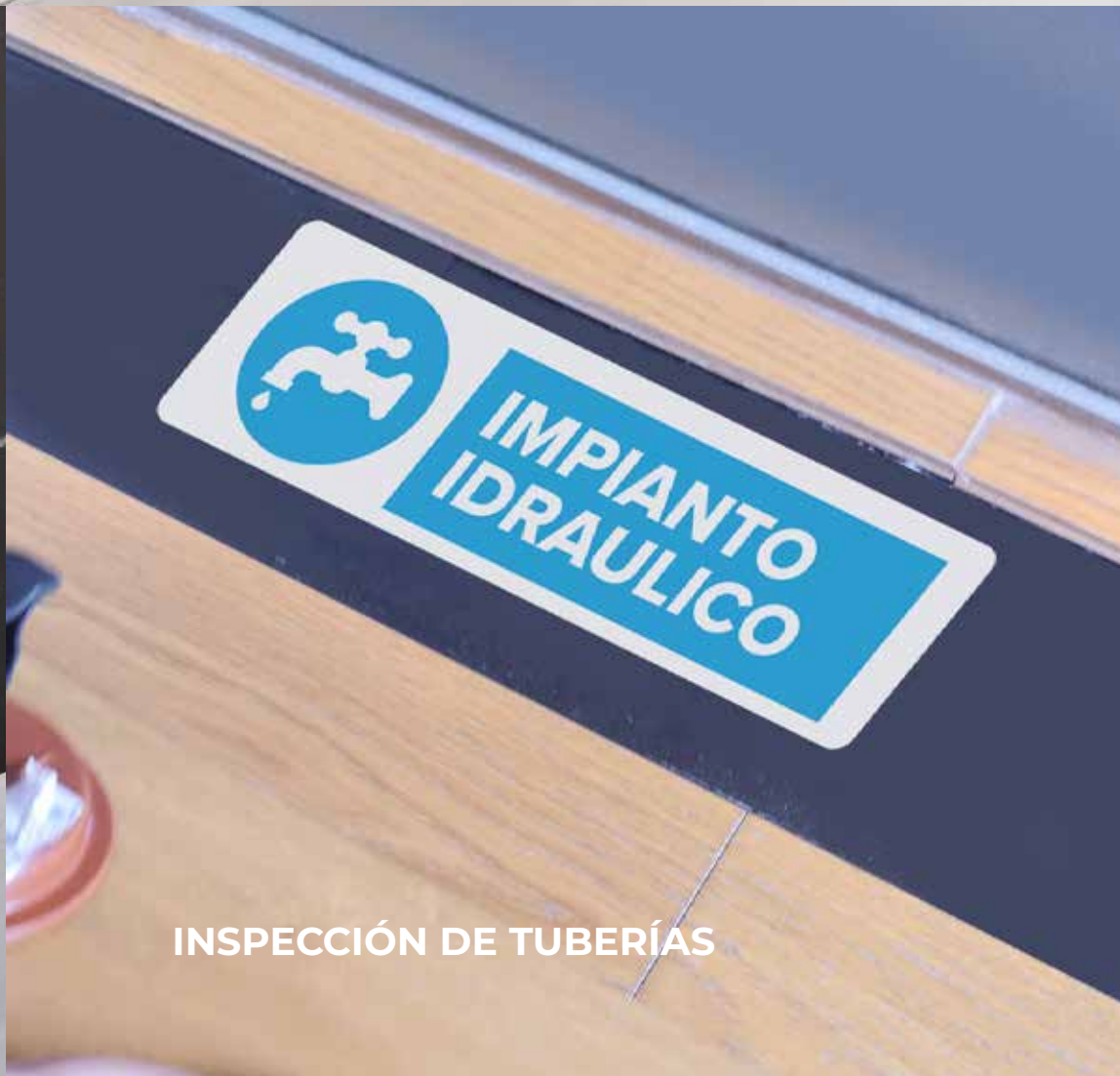
INSPECCIÓN DE TUBERÍAS