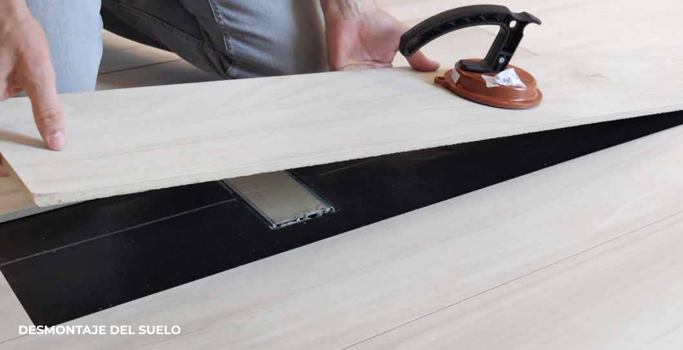
DESMONTAJE DEL SUELO