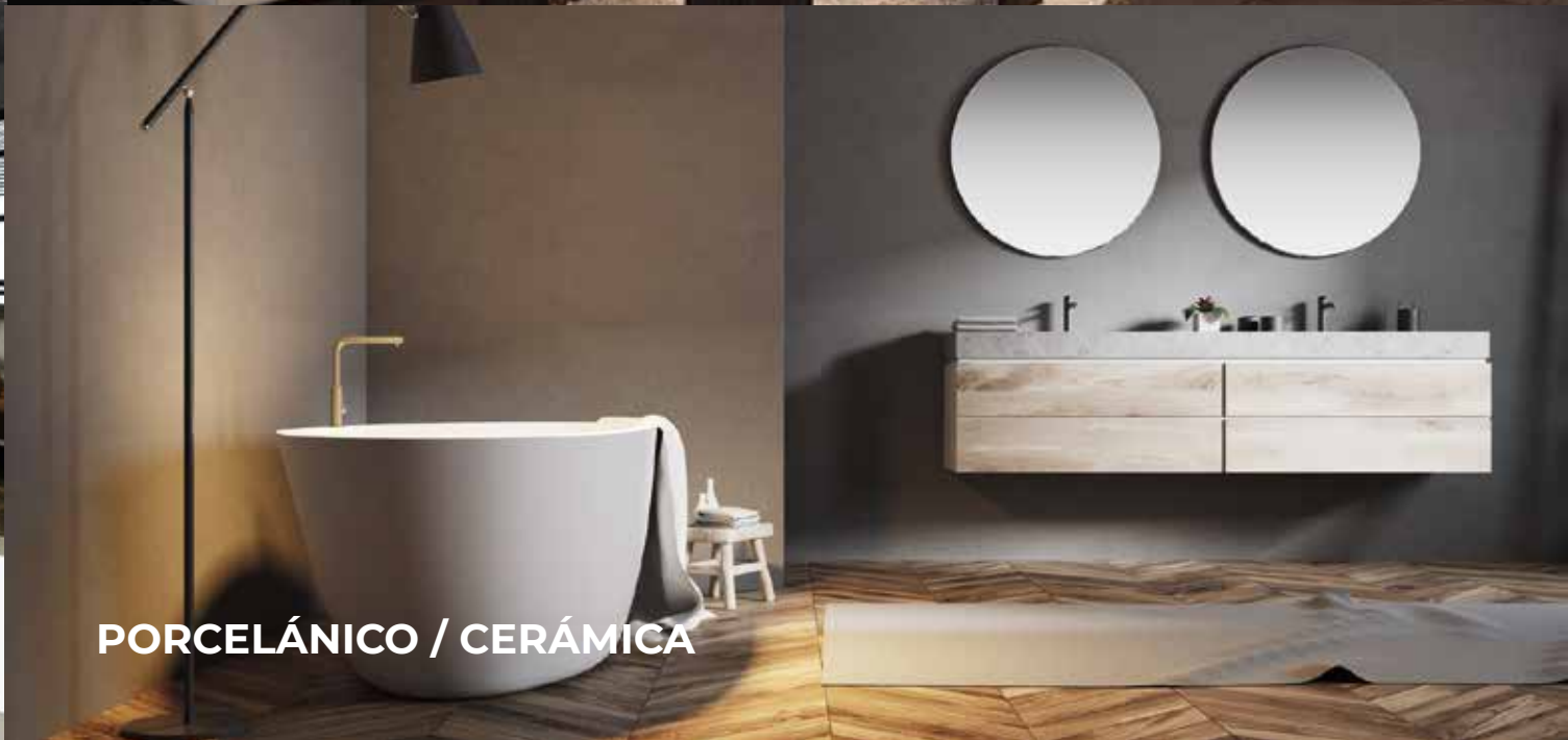
PORCELÁNICO / CERÁMICA