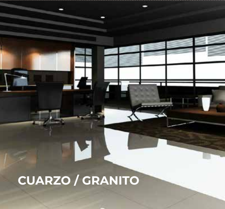
CUARZO / GRANITO