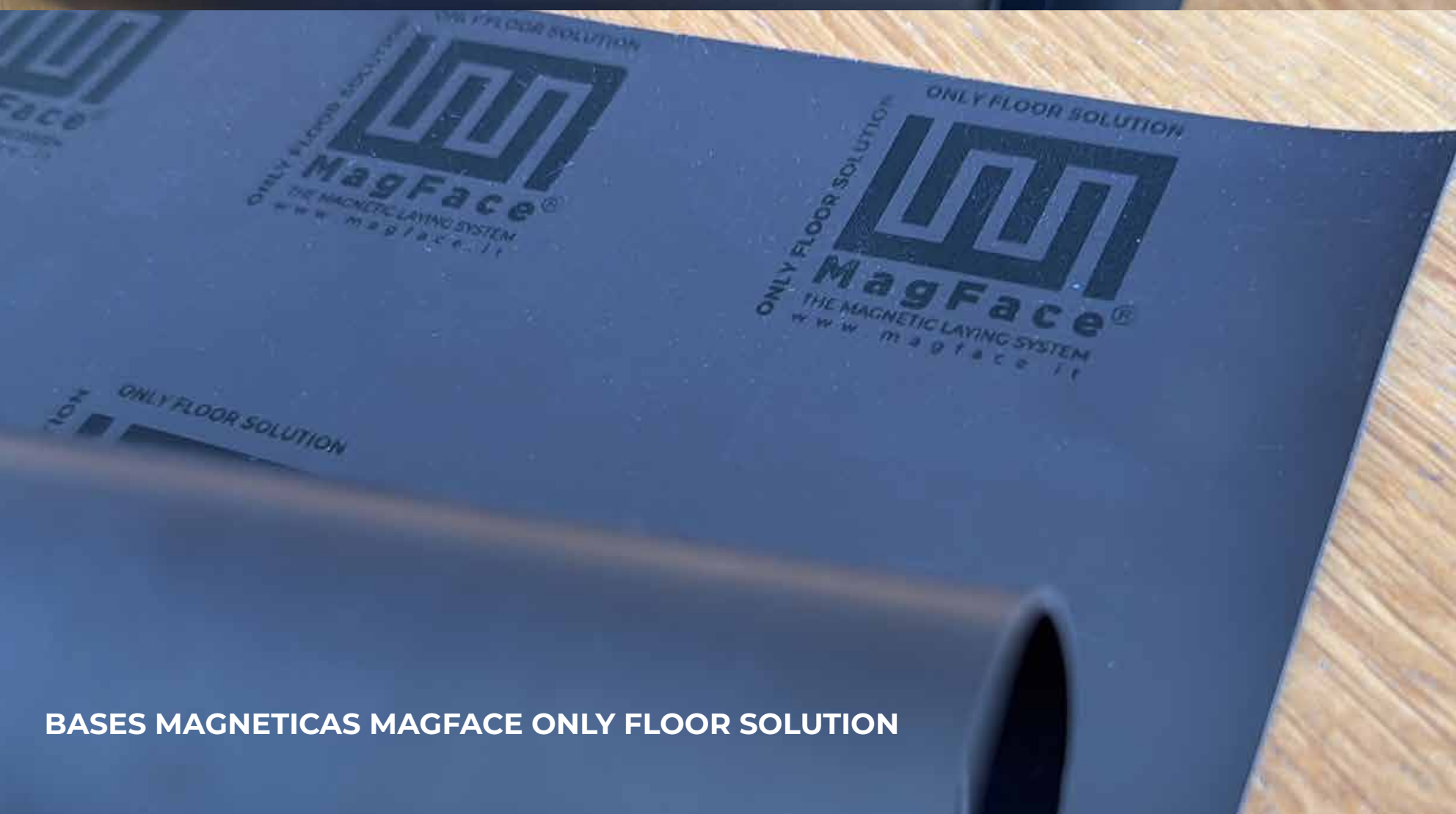
BASES MAGNETICAS MAGFACE ONLY FLOOR SOLUTION