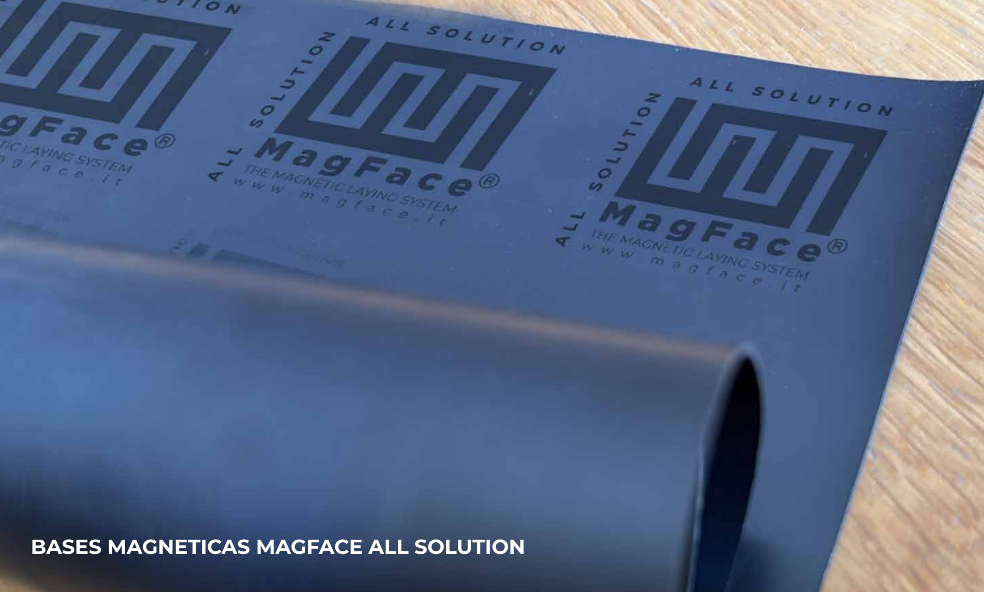
BASES MAGNETICAS MAGFACE ALL SOLUTION