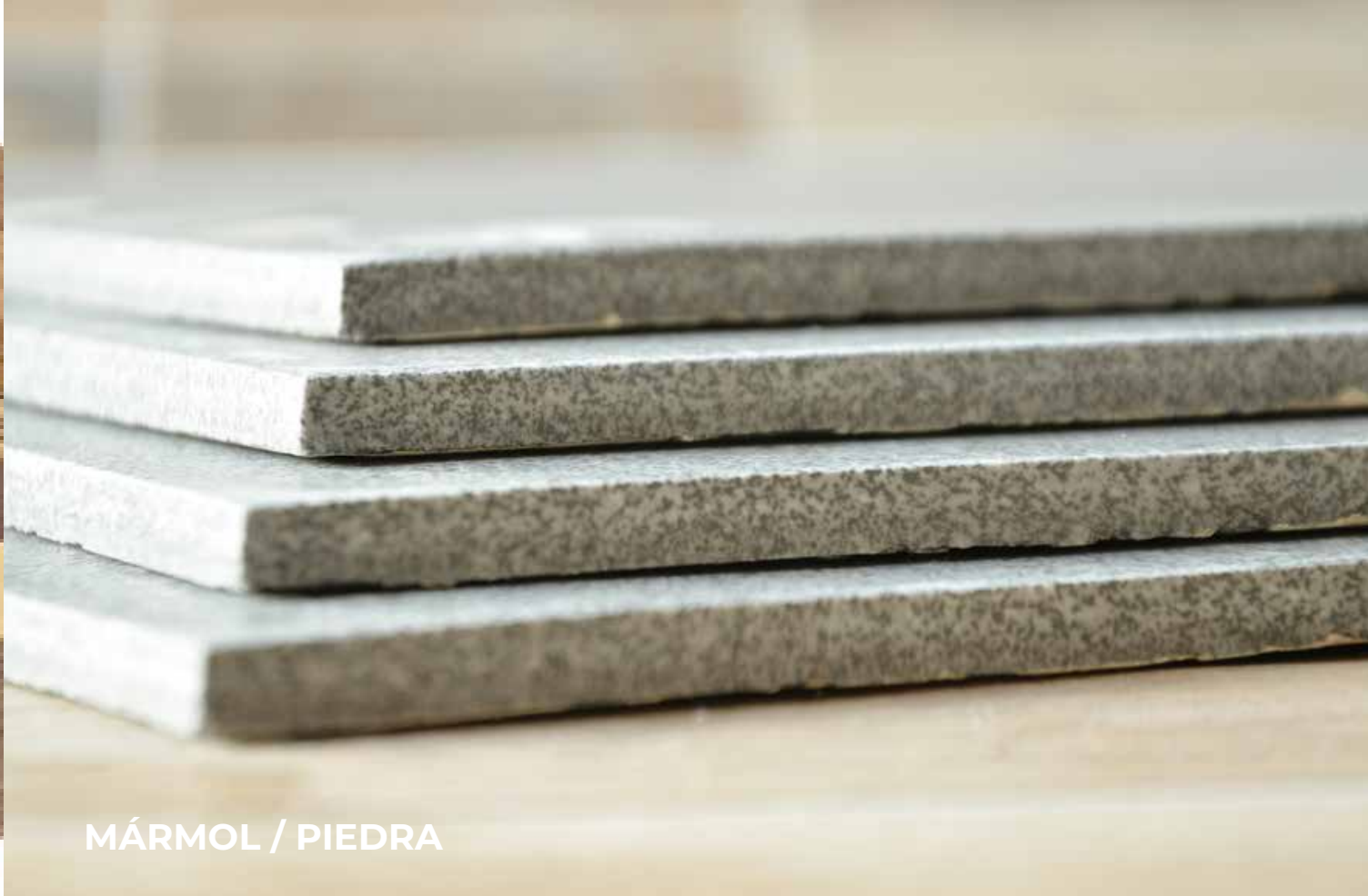
MÁRMOL / PIEDRA